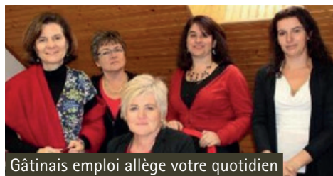
Gâtinais emploi allège votre quotidien

Une aide concrète peut devenir un jour indispensable et l'on pense parfois ne pas savoir où s'adresser ou ne jamais trouver la personne recherchée. Une recherche à l'« aveuglette » peut certes aboutir, mais parfois aussi générer de l'insatisfaction. Un organisme dédié est une garantie.